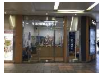
本川越站觀光諮詢處