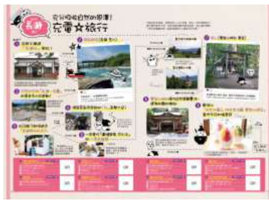
原創旅遊指南（左:封面、右:內頁）※參考圖像