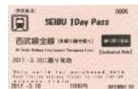
SEIBU 1Day Pass 車票樣本