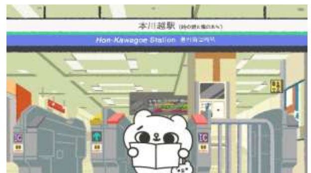
原創動畫 ※參考圖像