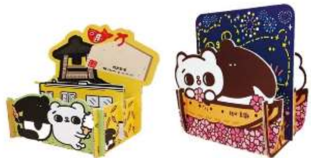
西武鐵道xLAIMO & 爽爽猫 原創限定贈品（置物架）（左：川越版、右：秩父版）※參考圖像